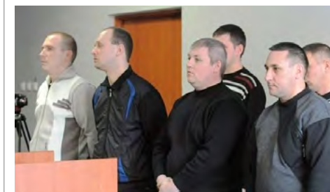
Полицейских, виновных в гибели задержанного, берут под стражу в зале суда